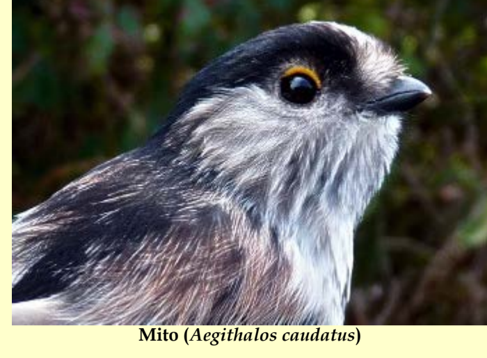
Mito ( Aegithalos caudatus )