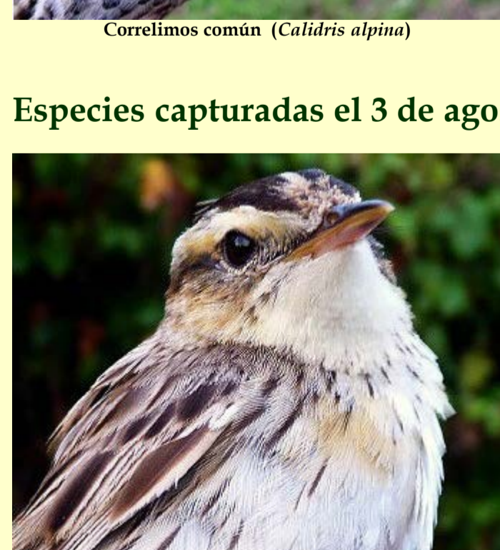
Carricerín cejudo ( Acrocephalus paludicola )