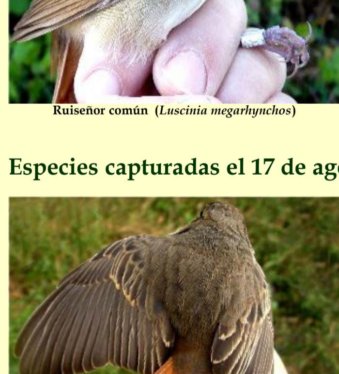
Pechiazul ( Luscinia svecica )