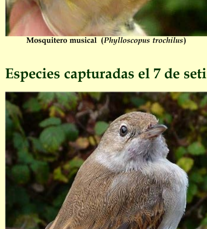
Curruca zarcera ( Sylvia communis )