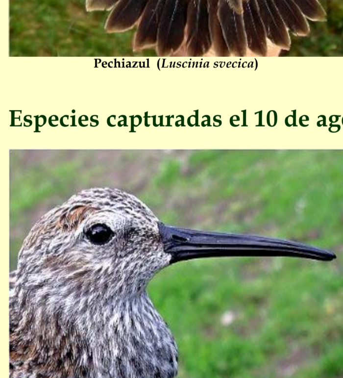
Correlimos común ( Calidris alpina )