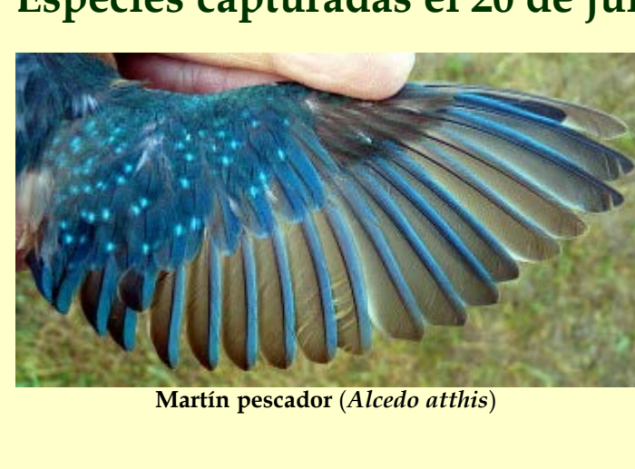
Martín pescador ( Alcedo atthis )