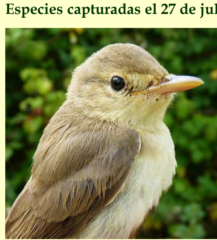
Zarcero común ( Hippolais polyglotta )