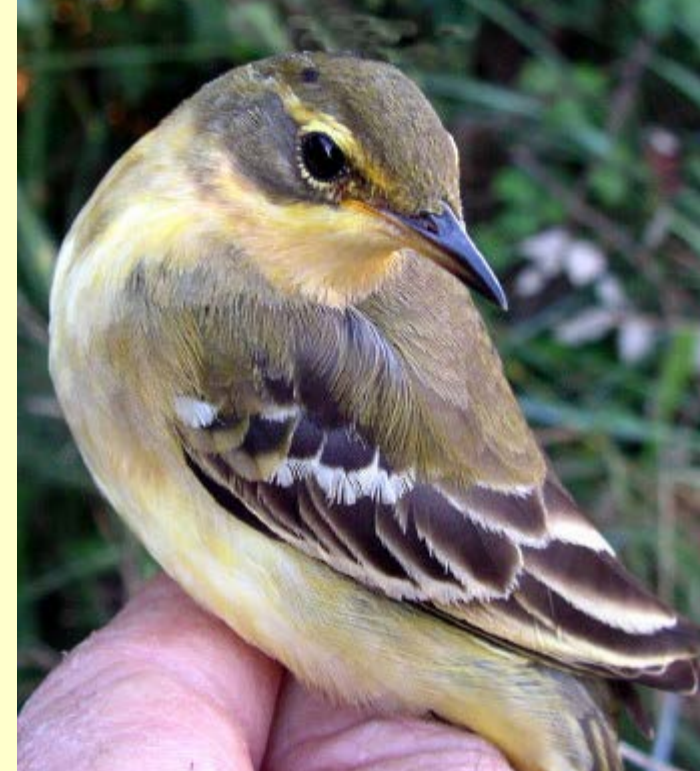
Lavandera boyera ( Motacilla flava )