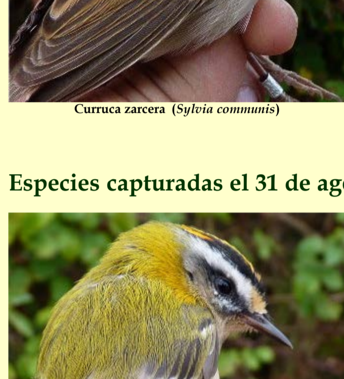
Reyzeuelo listado ( Regulus ignicapillus )