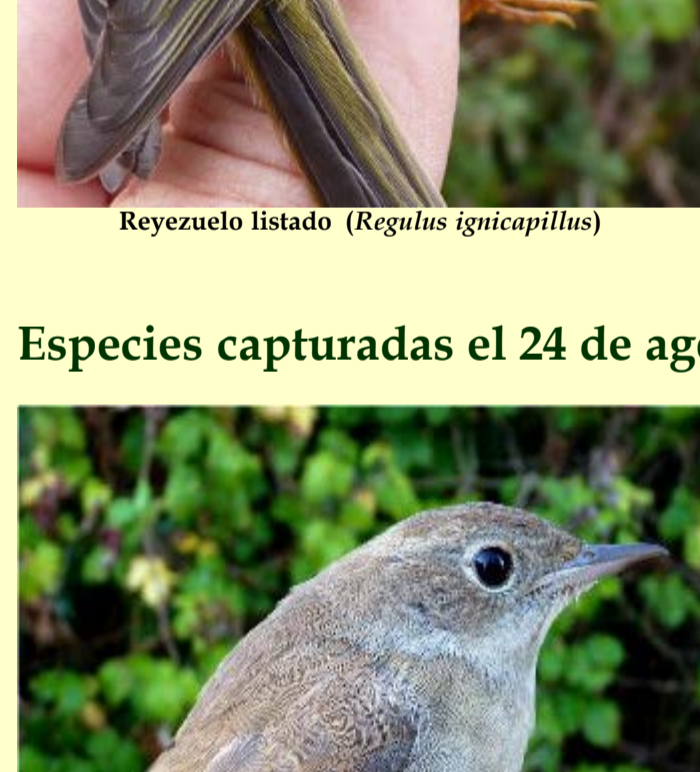
Ruiseñor común ( Luscinia megarhynchos )