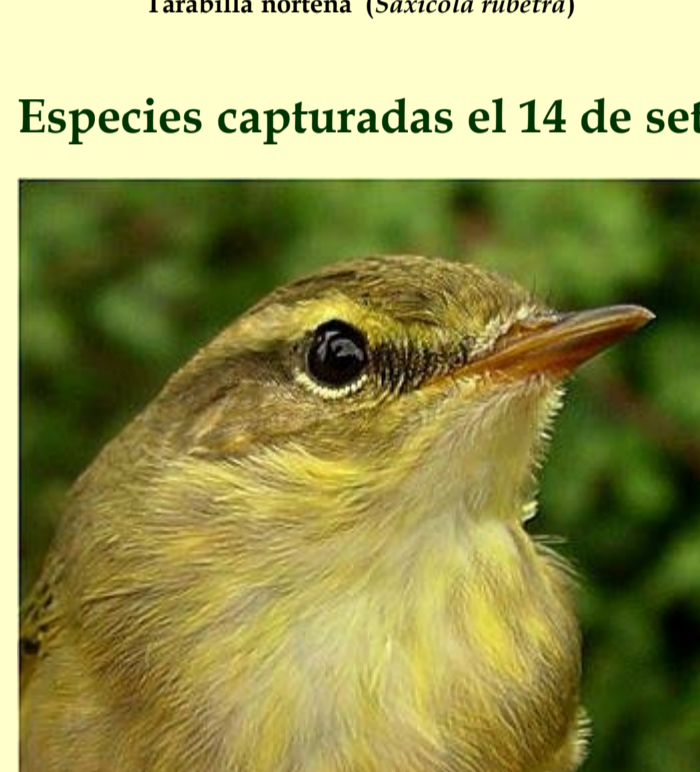
Mosquitero musical ( Phylloscopus trochilus )