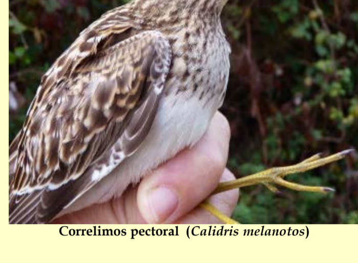
Correlimos pectoral ( Calidris melanotos )