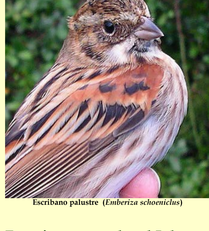
Escribano palustre ( Emberiza schoeniclus )